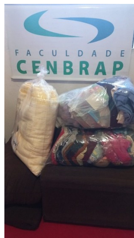
Figura 6: Doações entregues para a comunidade carente.