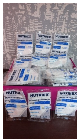
Figura 2: Entrega das Doações no Pronto Socorro Psiquiátrico Wassily Chuc