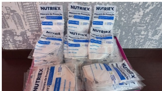
Figura 3: Entrega das Doações no Pronto Socorro Psiquiátrico Wassily Chuc