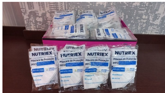
Figura 4: Entrega das Doações no Pronto Socorro Psiquiátrico Wassily Chuc